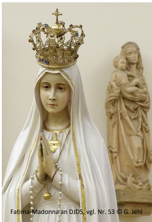
Fatima-Madonna an DJDS, vgl. Nr. 53

Herzliche Einladung an alle, die sich dieser Kurzform des Rosenkranzgebetes täglich ca. 5 Minuten anschließen wollen. Es geht so (vgl. Gotteslob Nr. 4 oder Angebot Nr. 3 vom 25.03.2020):